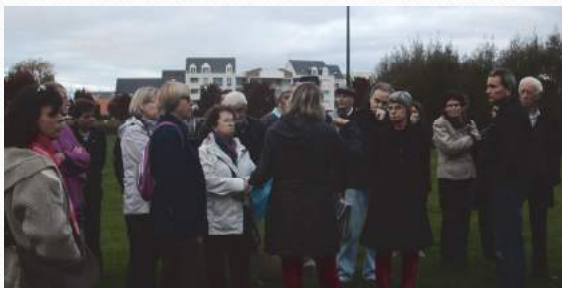
Déambulation sur l'espace Mandela – 22 octobre 2015

L'atelier citoyen s'est déroulé du 22 octobre 2015 au 16 janvier 2016. Cinq séances nous ont permis de réfléchir ensemble à l'aménagement de l'espace Mandela – Dulcie September afin de remettre aux élus de Lanester diverses propositions. Après un diagnostic de l'espace, de ses usages à notre représentation, nous nous sommes projetés dans le futur en imaginant l'espace Mandela de demain. Nous avons donc travaillé sur des principes d'action dont découlent les propositions que nous présentons dans ce document.