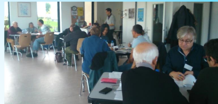
Maison de quartier l'Eskale - 29 novembre 2014