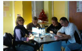
Maison de quartier du Penher – 17 janvier 2015