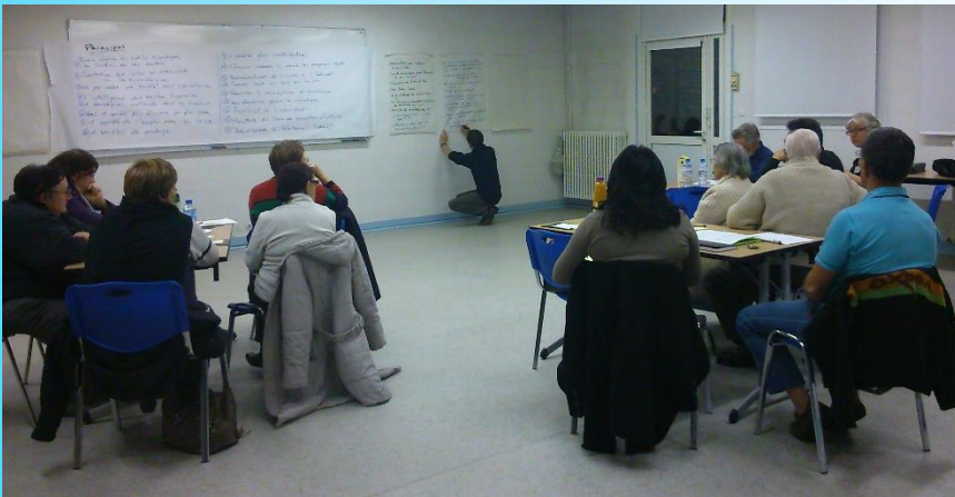
Maison des Association-16 décembre 2014