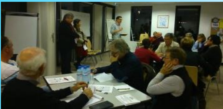
Maison de quartier de l'Eskale – 28 novembre 2014