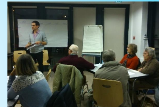
Maison de quartier de l'Eskale -28 novembre 2014