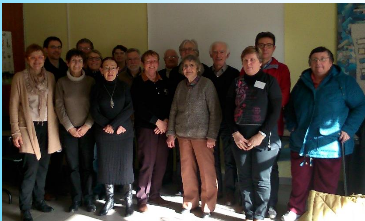
Maison de quartier du Penher - 17 janvier 2015